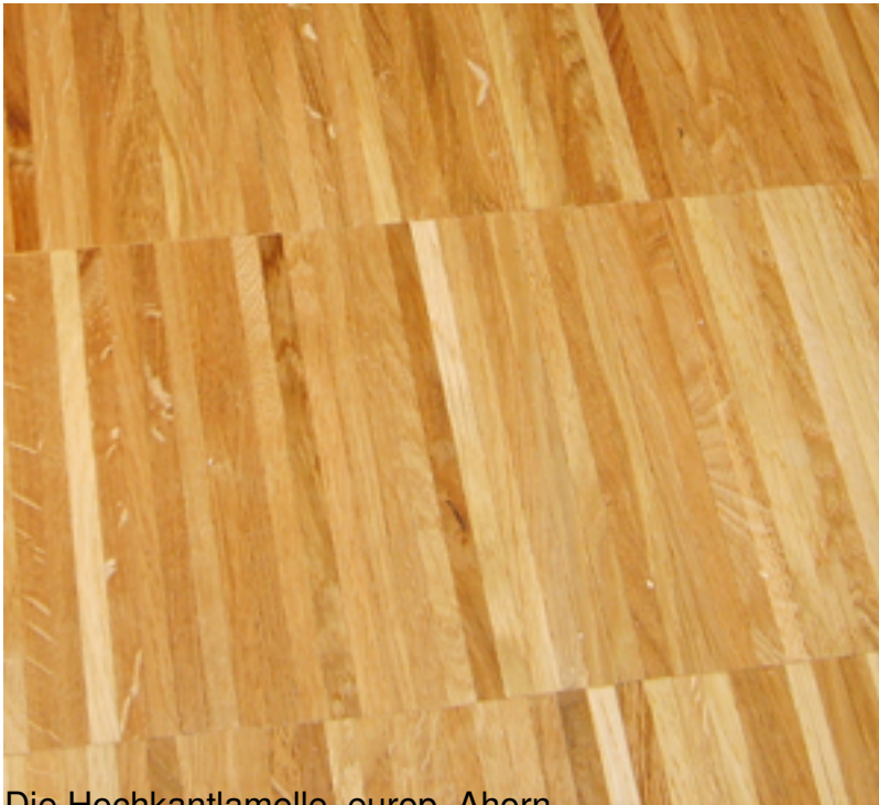
Die Hochkantlamelle, euren Ahorn