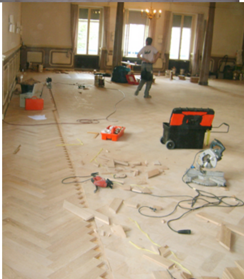
Die Renovierung des Fußbodens im Fischgrätenmuster