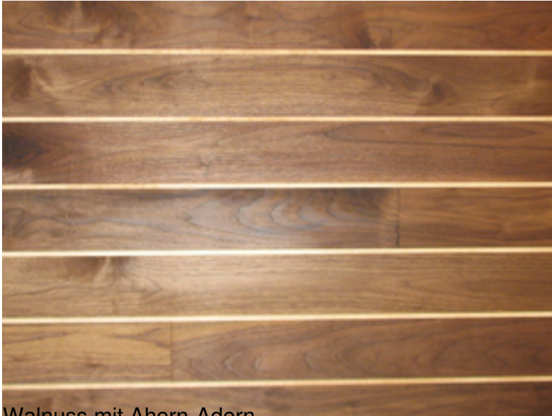
Walnuss mit Ahorn-Adern