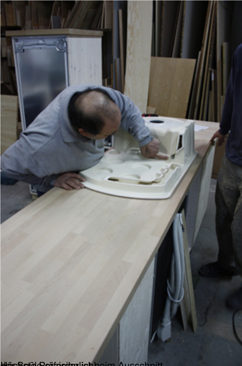
Hier wird die Spüle beim Ausschneiden