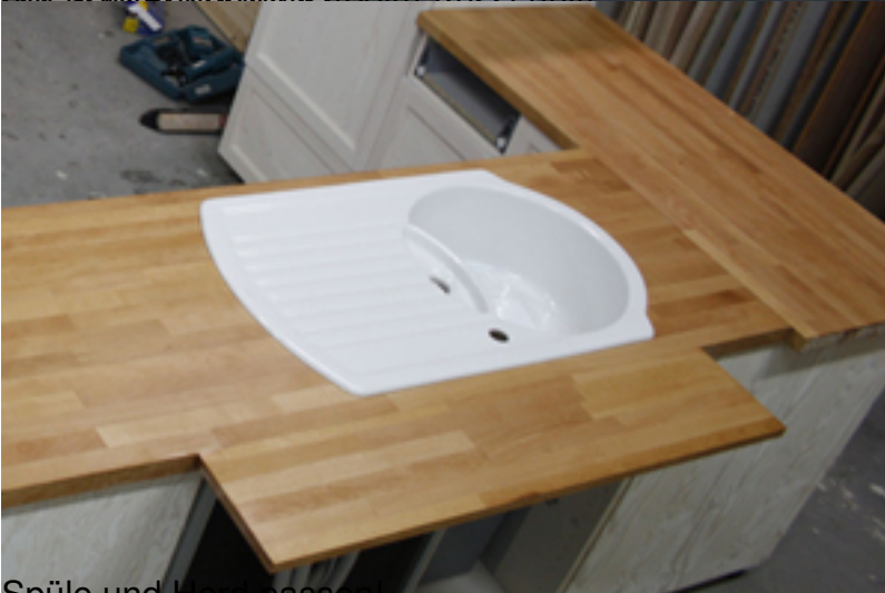
Spüle und Herd passen!