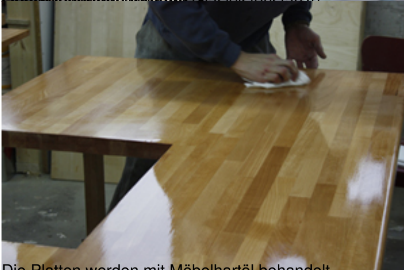
Die Platten werden mit Möbelhartöl behandelt