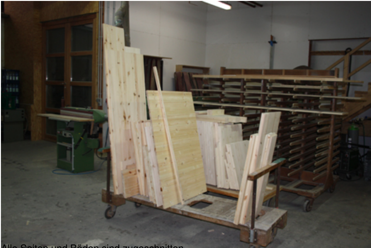
Alle Seiten und Böden sind zugeschnitten