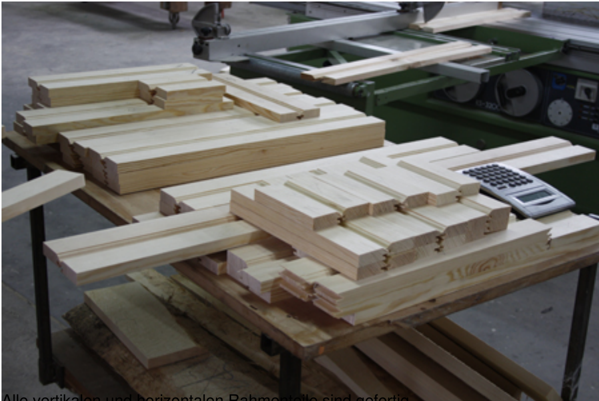
Alle vertikalen und horizontalen Rahmenteile sind gefertigt.