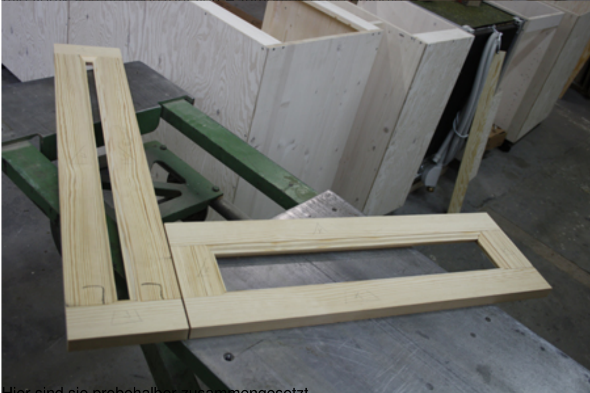
Hier sind sie probeweise zusammengesetzt.