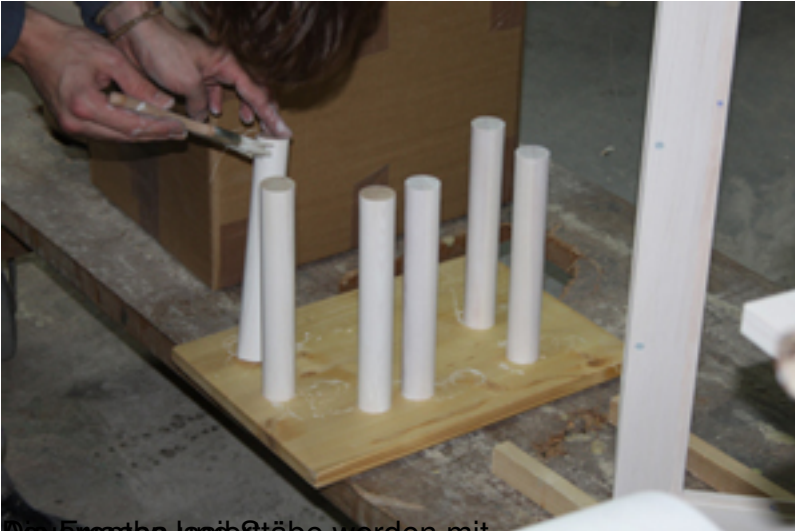
Die fünfzehn Leimböcke werden mit