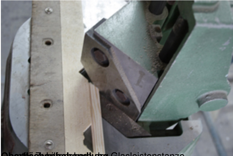
Oberflächenstruktur durch Glasleiste stanzen