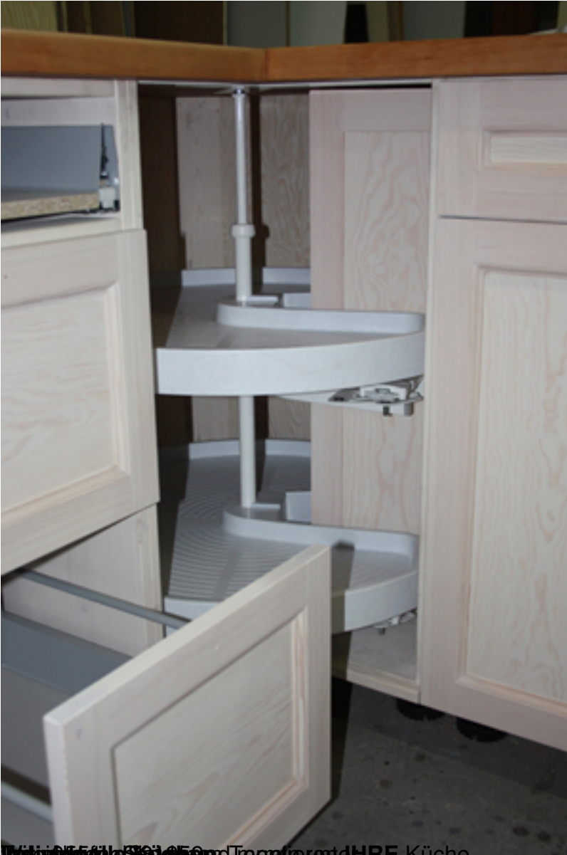
Wikipedia, Bild: 300 und Teamfoto der HRE Küche.