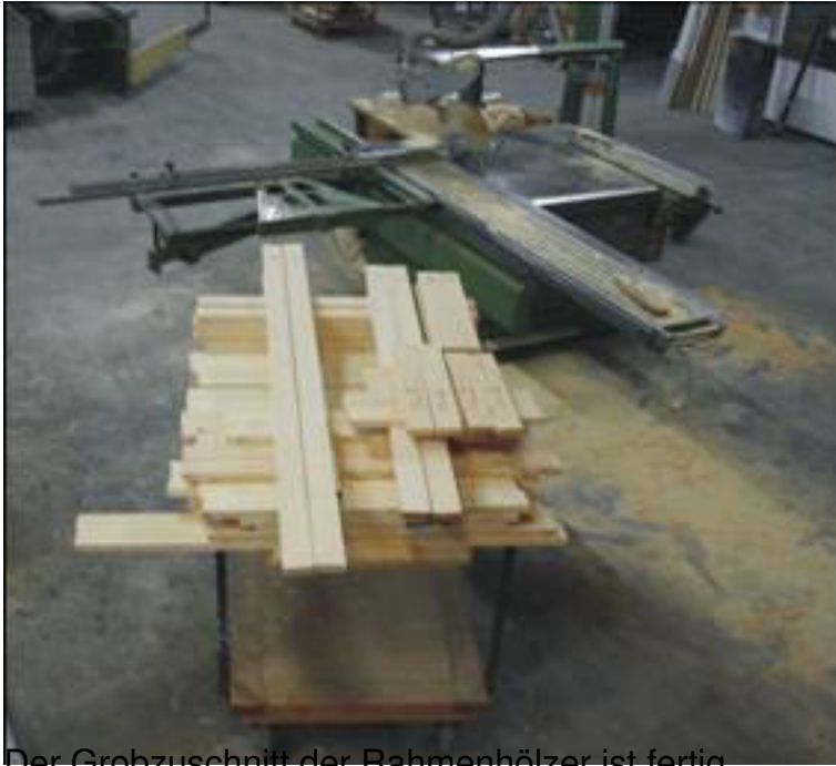
Der Grobzuschnitt der Rahmenhölzer ist fertig.