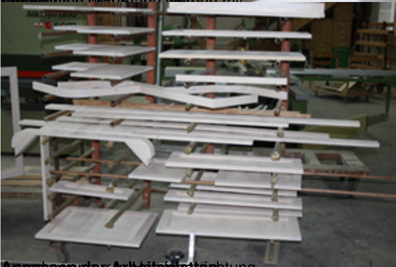
Anpassen der Arbeitsplattenrichtung.