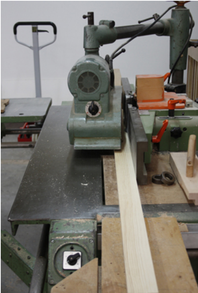
Auf der Tischfräse wird ein Profil an die aufrechten Rahmenhölzer gefräst.