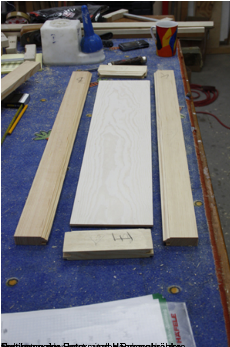
Fertiggestellte Platten und Hängeschränke