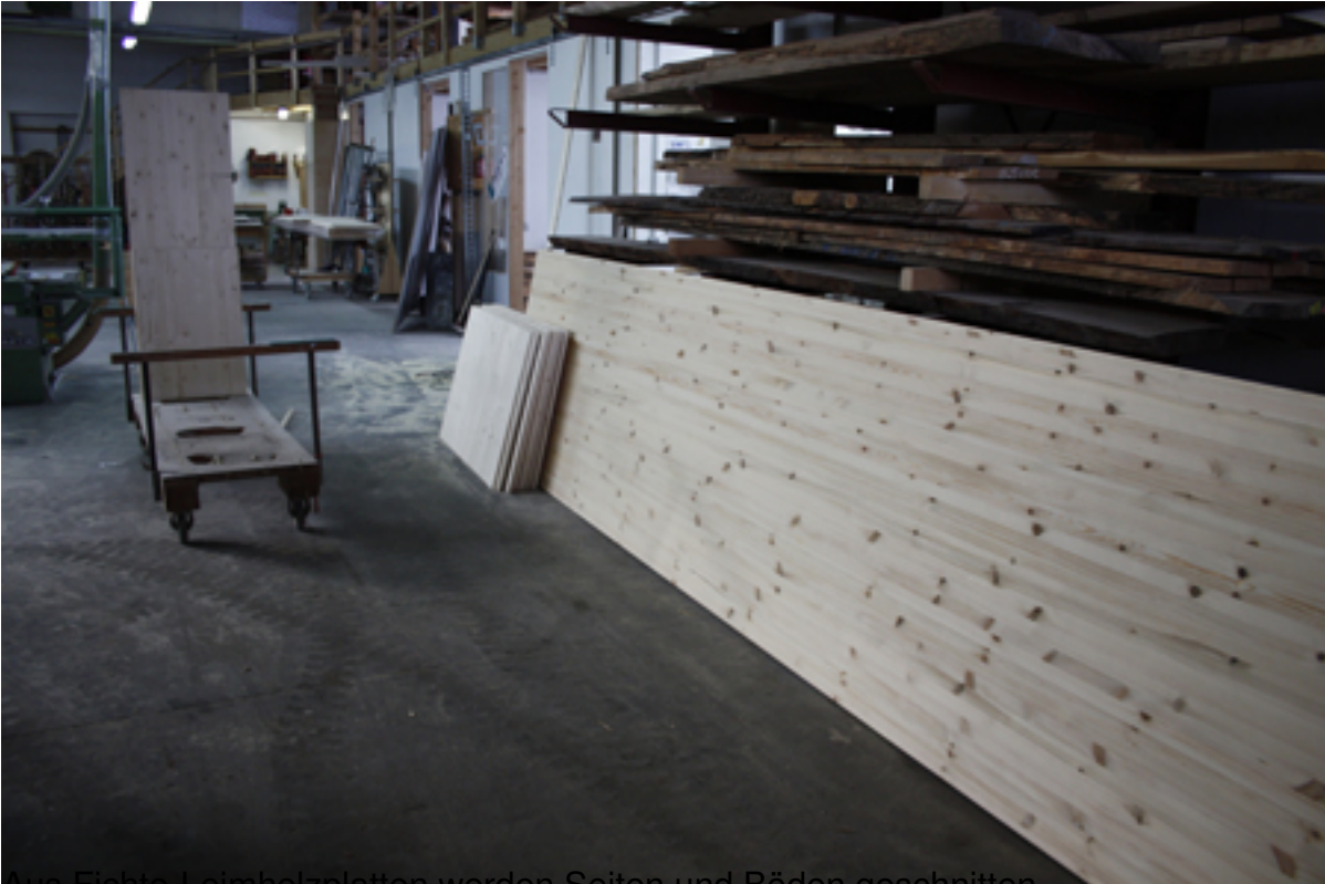
Aus Fichte-Leimholzplatten werden Seiten und Böden geschnitten