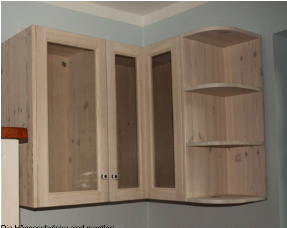
Die Hängeschränke sind montiert