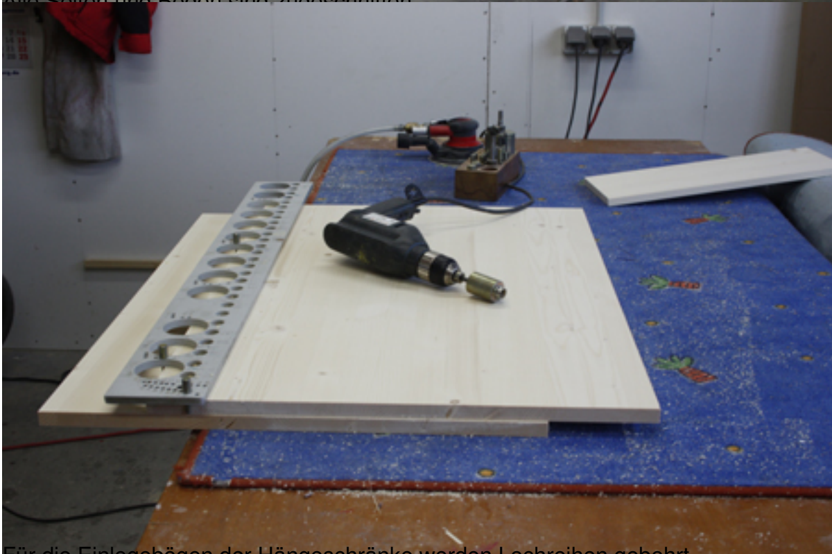
Für die Einlegebögen der Hängeschränke werden Lochreihen gebohrt.