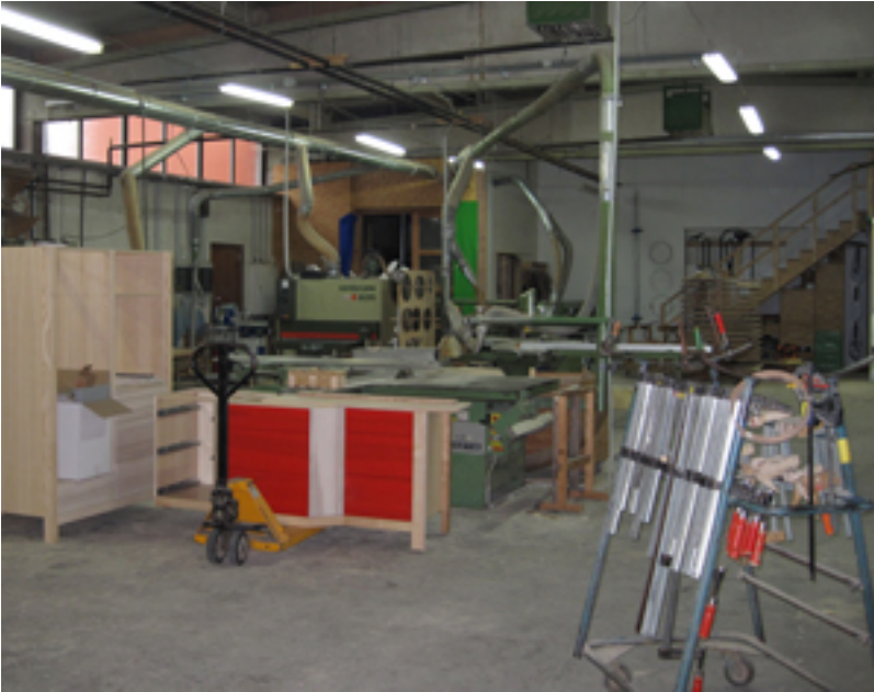
Ein Blick in die Werkstatt in Rosdorf-Sieboldshausen