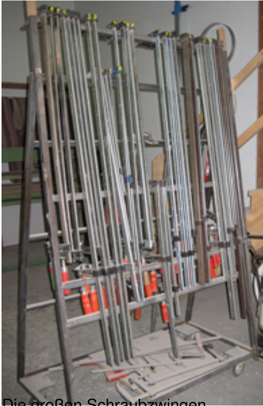
Die großen Schraubzwingen