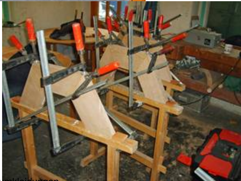
Verleimen von Säulenumkleidungen