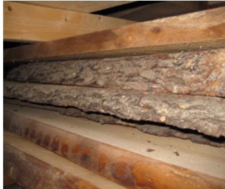
Eines der Holzlager