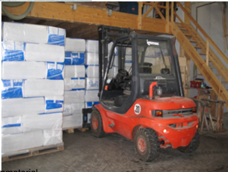
Das Lager für Dämmmaterial