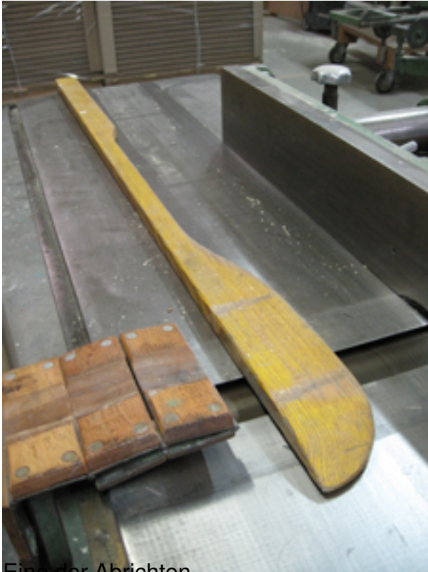
Eine der Abrichten